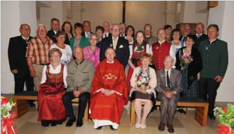
29. Mai 2023: Fest der Jubelpaare