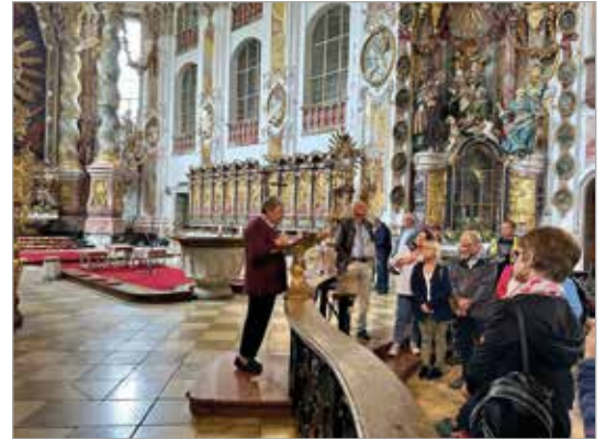
24. Juni 2023: kfb/KMB-Ausflug nach Bayern Nach dem Gottesdienst erklärte die Mesnerin die prächtige Asambasilika Osterhofen in äußerst kompetenter Weise