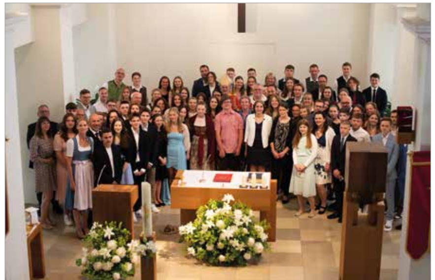
17. Juni 2023: Firmung